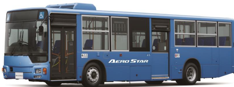
新型「エアロスター」

省燃費性と環境性能を備えた大型路線バス「エアロスター」は、日々の交通手段として多くの人びとの生活をこれからも結んでいきます。